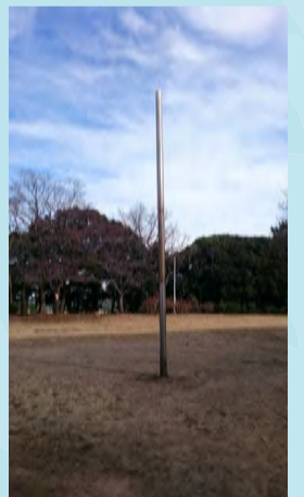
ロープ遊具が復活する予定の「ピラミッド公園」(幕張西第3公園)

12月議会で老朽化した遊具の更新が提案され可決されました。千葉市では遊具の整備に個人や団体からの寄付を募っていますが、民間企業からの寄付金第1号で、保育所・小学校・公園に遊具が設置されます。以前あった遊具は放火で焼失し、焼け跡が残るポールだけが寂しげに立っています。遊具がなくなったことで、子どもたちもいなくなり、閑散とした公園になってしまいました。復活を機に、再び賑わいが戻ることを期待しています。