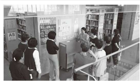
地域ごとに分類された図書館内部