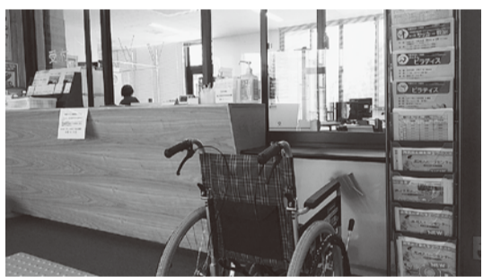
受付カウンターは車いすでも利用できる高さです

高洲、磯辺ともに指定管理者のNASが運営に当たり、利用増の努力をしているところですが、特に磯辺では障がい者スポーツであるボッチャ（高齢者にも面白い！）の講座に場所を提供するなど、新しい試みが注目されます。個人使用、専用