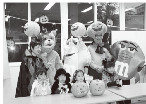
楽しかったハロウィンパーティ。英語クイズ・英語ビンゴに盛り上がりました。