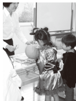
カボチャに目をかいています。かわいいジャック・オ・ランタンになるといいな。

「ぽれぽれ」とはスワヒリ語で「ゆっくり」「あせらず」の意味です。美浜区で暮らす親子が、ゆっくり・あせらず育児ができるようにとの願いをこめて、市民ネットワークみはまが開催している親子食育サークルです。